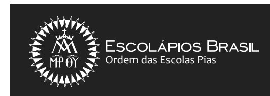
Versão Horizontal Negativa

ESCOLÁPIOS BRASIL Ordem das Escolas Pias