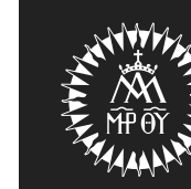
Versão Horizontal Monocromática Negativa

ESCOLÁPIOS BRASIL Colégio São Miguel Arcanjo