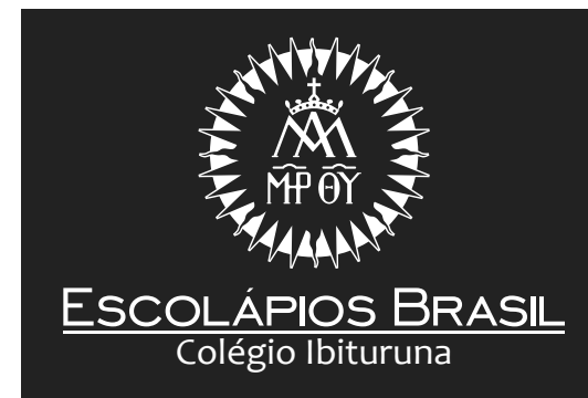
Versão Vertical Monocromática Negativa