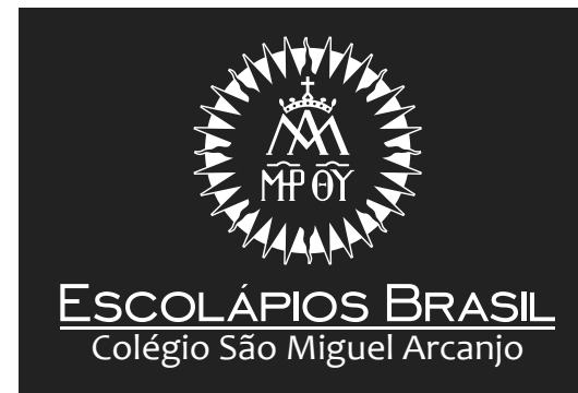
Versão Vertical Monocromática Negativa

ESCOLÁPIOS BRASIL Colégio São Miguel Arcanjo