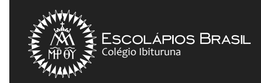
Versão Horizontal Monocromática Negativa