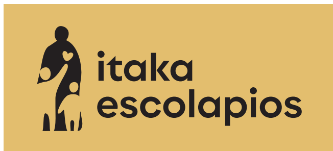
Fondos no corporativo (tono claro)