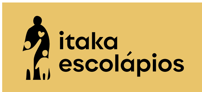
Fundos no corporativo (tons claro)